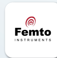
Femto Instrumentación, s.l.