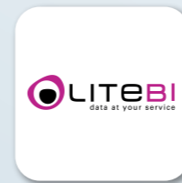
Lite Internet Solutions, s.l.