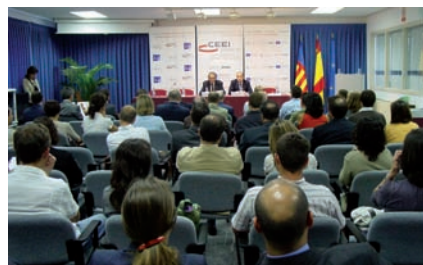
De arriba a abajo: CEDIVET, Trinus Vacuum Projects, AMT Biometrics, Nubesis, y vista general de los asistentes al acto de entrega de los premios en las instalaciones de CEEI Valencia

lización GPS de vehículos, personas o mascotas en tiempo real, y su seguimiento en mapa de Microsoft Virtual Earth y Google Maps, además de por un sistema de vídeo vigilancia y observación autónoma que permite vigilar y preservar el medio ambiente.